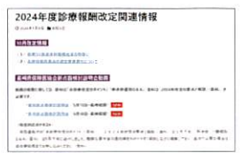
2024年診療報酬改定関連ページ